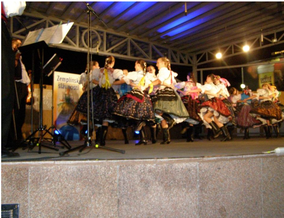
Koštovka jesene – Kráľovský Chlmec